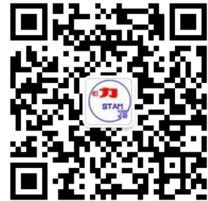
江苏省力学学会公众号